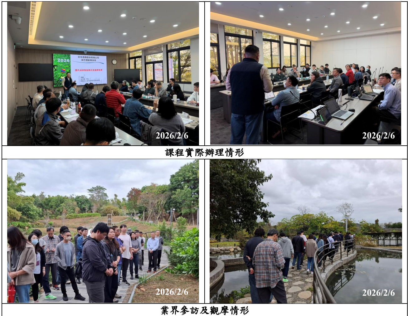
圖 3 活動實際參與情形